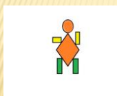
Slika 6: Figura iz geometrijskih likov

Pripomočki: lepenka, papir, škarje, lepilo, ravnilo.