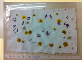
SLIKA 1. 2: Primer ročno izdelanega papirja